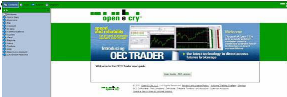
Figura 5: Ilegível